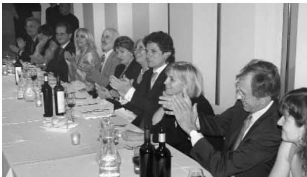
Alcuni momenti della serata